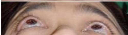
両側眼瞼下垂症 (左側眼球陥凹を伴う)